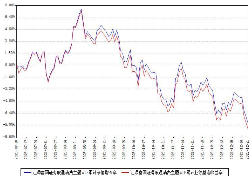
汇添富国证港股通消费主题ETF累计净值增长率与同期业绩基准收益率对比图

注：本《基金合同》生效之日为2025年07月10日，截至本报告期末，基金成立未满一年。本基金建仓期为本《基金合同》生效之日起6个月，截至本报告期末，本基金尚处于建仓期中。