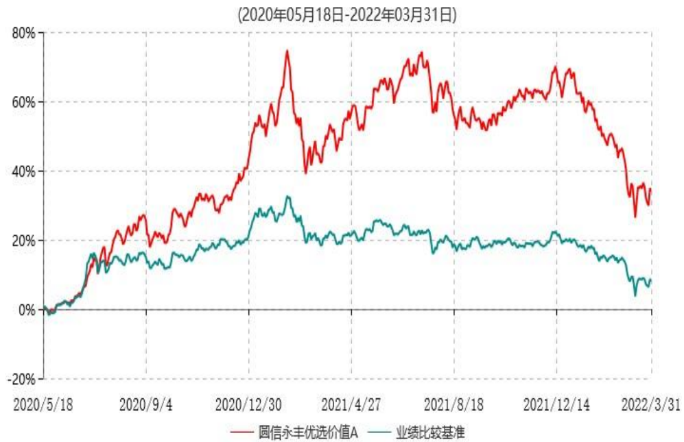
圆信永丰优选价值A累计净值增长率与业绩比较基准收益率历史走势对比图