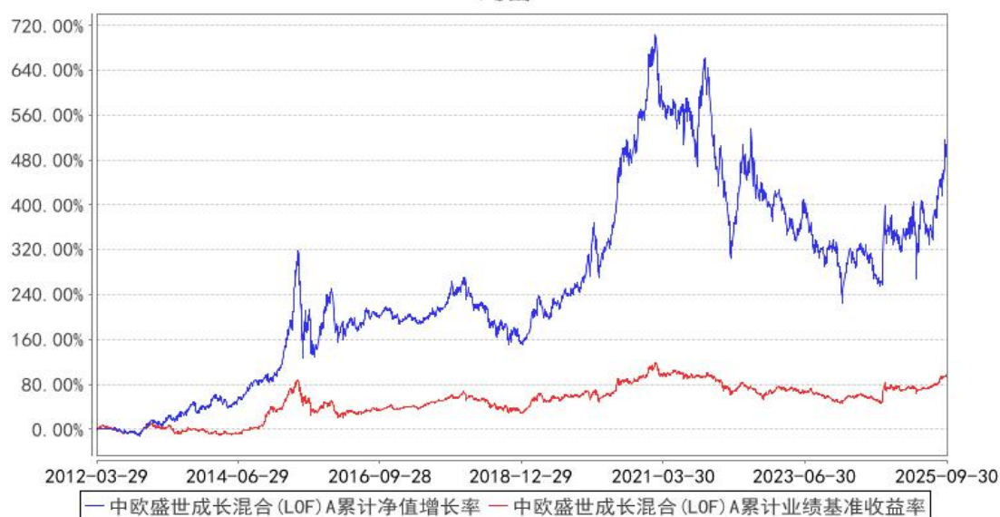
中欧盛世成长混合(LOF) A 累计净值增长率与同期业绩比较基准收益率的历史走势对比图