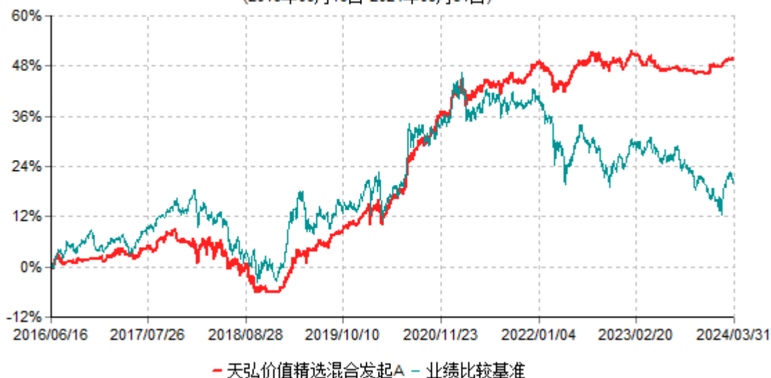
天弘价值精选混合发起A累计净值增长率与业绩比较基准收益率历史走势对比图 (2016年06月16日-2024年03月31日)