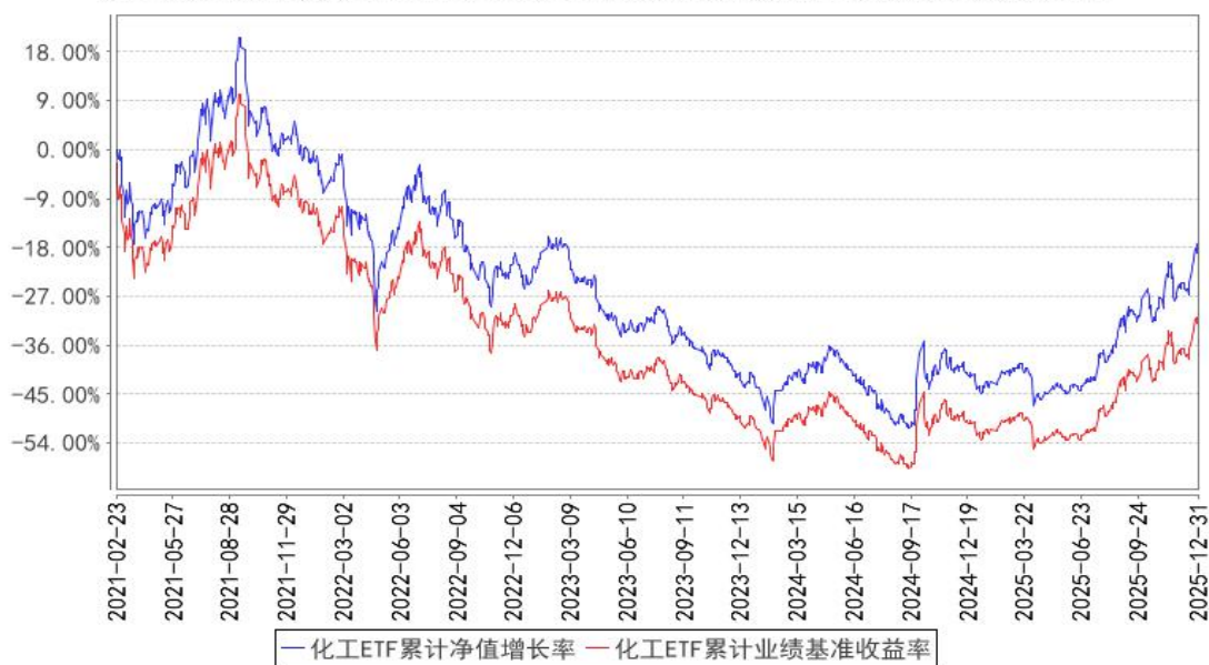
化工ETF累计净值增长率与同期业绩比较基准收益率的历史走势对比图

注：1、本基金基金合同于 2021 年 02 月 23 日生效。2、截至建仓期结束，本基金的各项投资比例已达到基金合同中规定的各项比例。