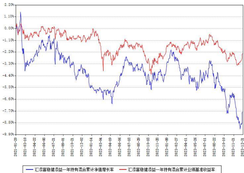
汇添富稳健添益一年持有混合累计净值增长率与同期业绩基准收益率对比图

注：本基金建仓期为本《基金合同》生效之日（2021年01月20日）起6个月，建仓期结束时各项资产配置比例符合合同约定。