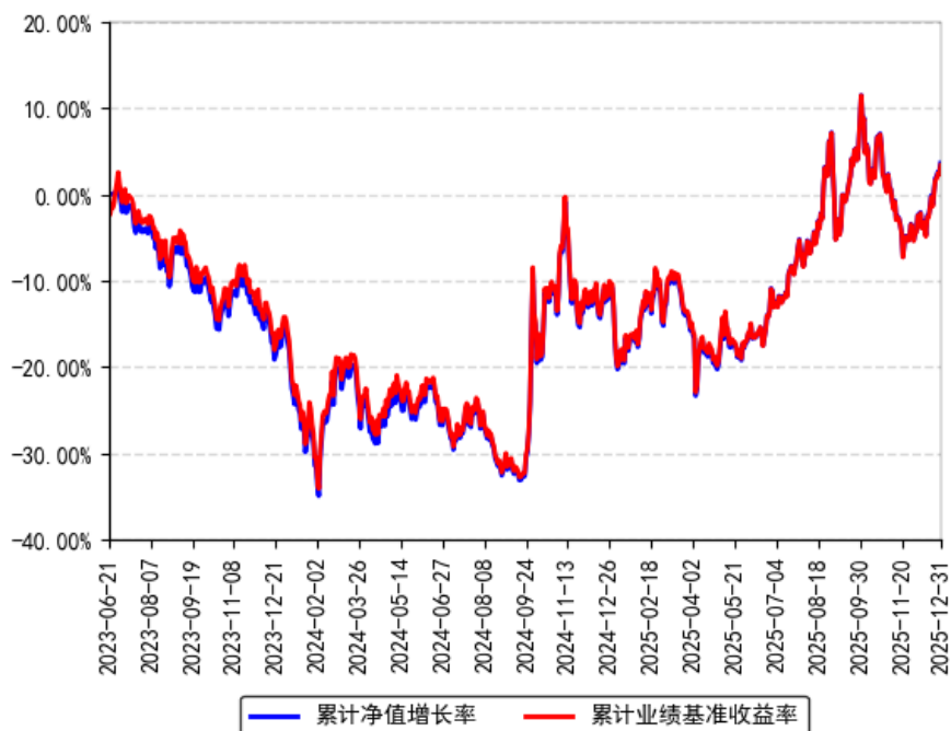
南方中证国新央企科技引领ETF累计净值增长率与同期业绩比较基准收益率的历史走势对比图