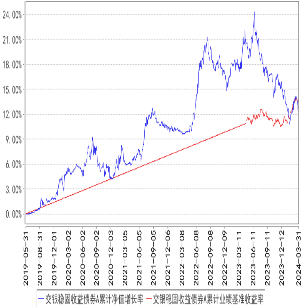
交银稳固收益债券A累计净值增长率与同期业绩比较基准收益率的历史走势对比图