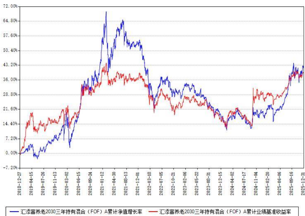
汇添富养老2030三年持有混合 (FOF) Y累计净值增长率与同期业绩基准收益率对比图