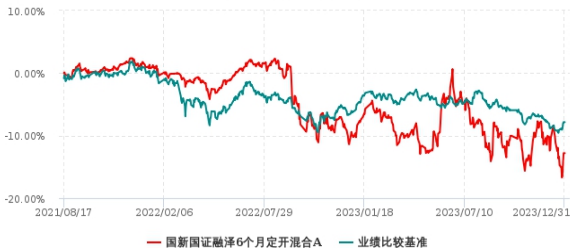
国新国证融泽6个月定开混合C累计净值增长率与业绩比较基准收益率历史走势对比图