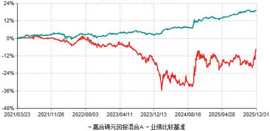
嘉合锦元回报混合A累计净值增长率与业绩比较基准收益率历史走势对比图 (2021年03月23日-2025年12月31日)