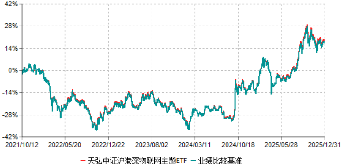
天弘中证沪港深物联网主题ETF累计净值增长率与业绩比较基准收益率历史走势对比图 (2021年10月12日-2025年12月31日)