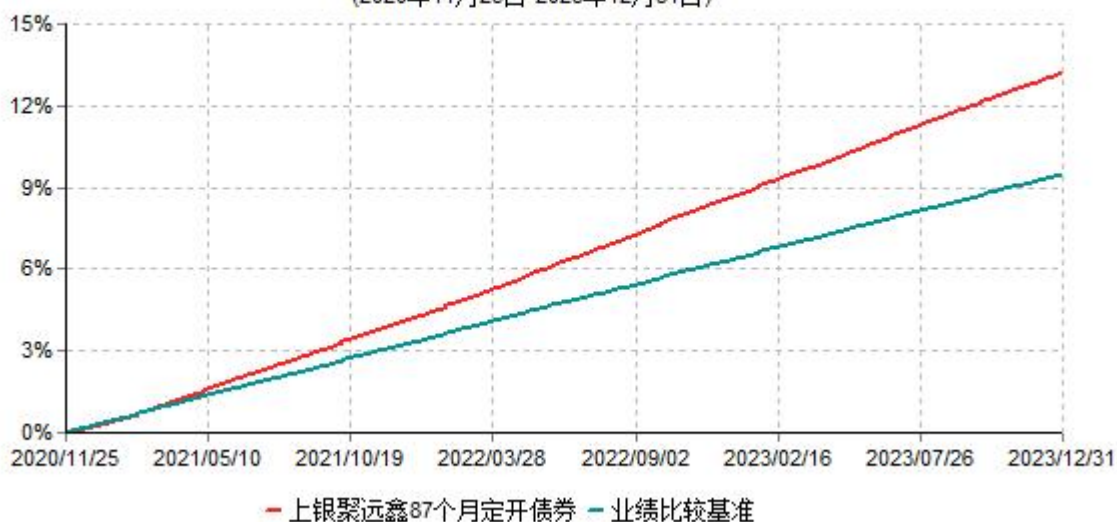
上银聚远鑫87个月定期开放债券型证券投资基金累计净值增长率与业绩比较基准收益率历史走势对比图 (2020年11月25日-2023年12月31日)

注：本基金合同生效日为2020年11月25日，自基金合同生效日起6个月内为建仓期，建仓期结束时各项资产配置比例符合基金合同约定。