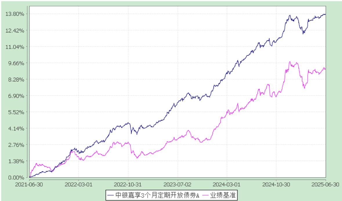
中银嘉享 3 个月定期开放债券型证券投资基金 累计净值增长率与业绩比较基准收益率的历史走势对比图 (2021 年 6 月 30 日至 2025 年 6 月 30 日)