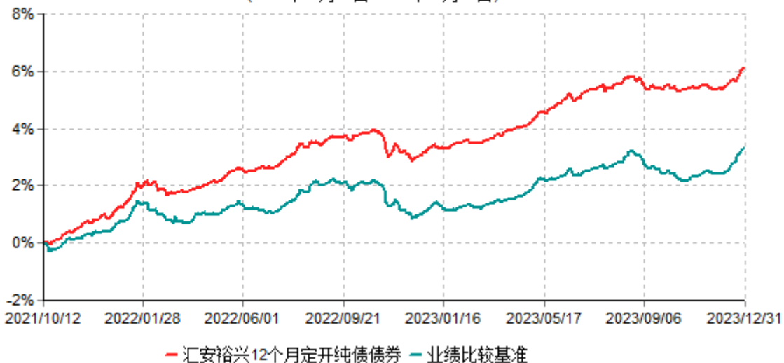
汇安裕兴12个月定期开放纯债债券型发起式证券投资基金累计净值增长率与业绩比较基准收益率历史走势对比图 (2021年10月12日-2023年12月31日)