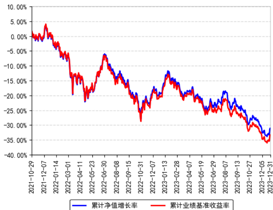
南方MSCI中国A50互联互通ETF累计净值增长率与同期业绩比较基准收益率的历史走势对比图