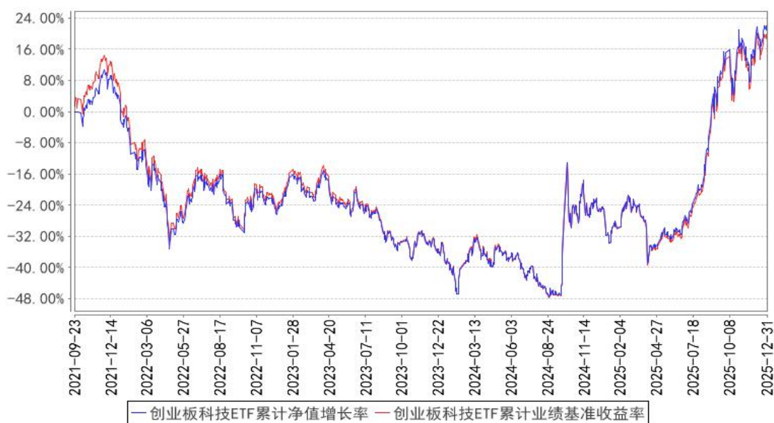
创业板科技ETF累计净值增长率与同期业绩比较基准收益率的历史走势对比图

注：图示日期为 2021 年 9 月 23 日至 2025 年 12 月 31 日。