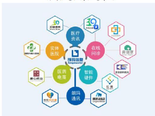
朗玛信息医疗生态系统