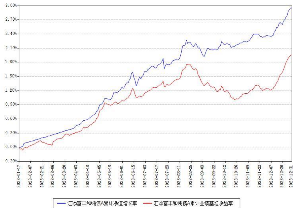
汇添富丰和纯债A累计净值增长率与同期业绩基准收益率对比图