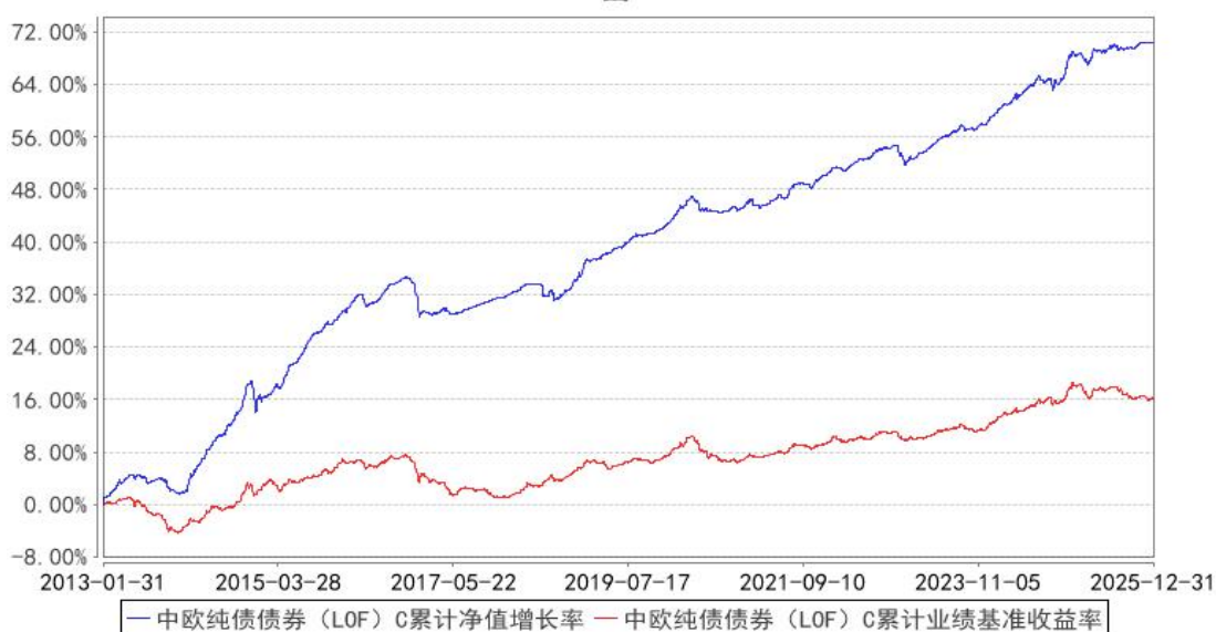
中欧纯债债券（LOF）C 累计净值增长率与同期业绩比较基准收益率的历史走势对比图