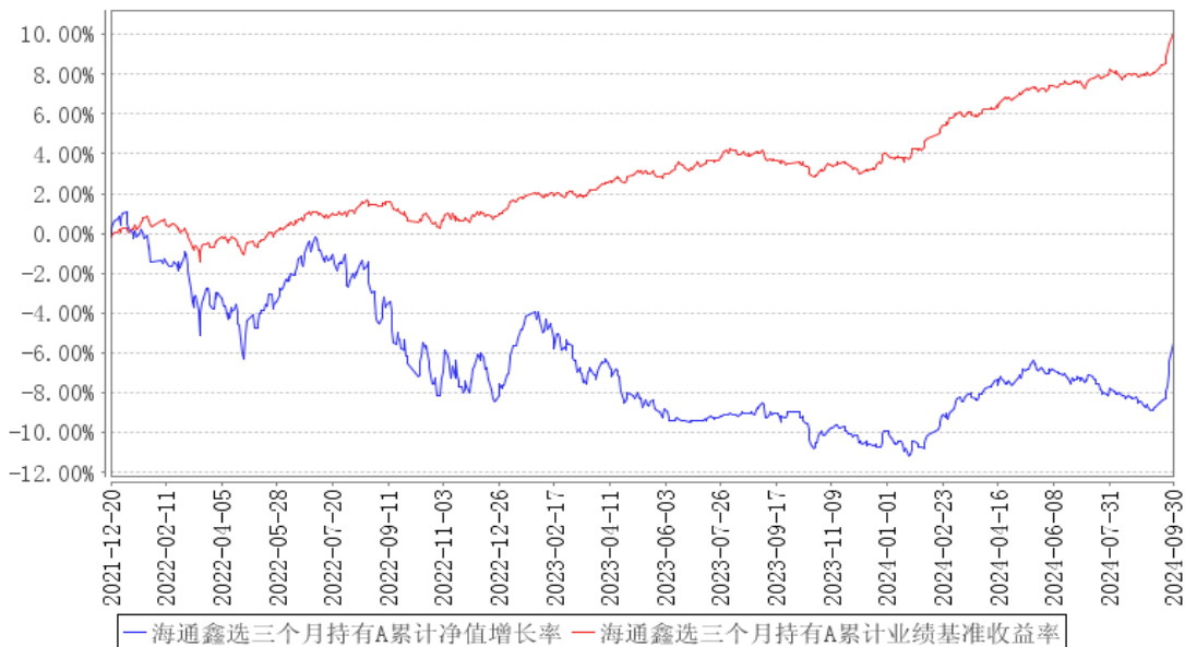
海通鑫选三个月持有A累计净值增长率与同期业绩比较基准收益率的历史走势对比图