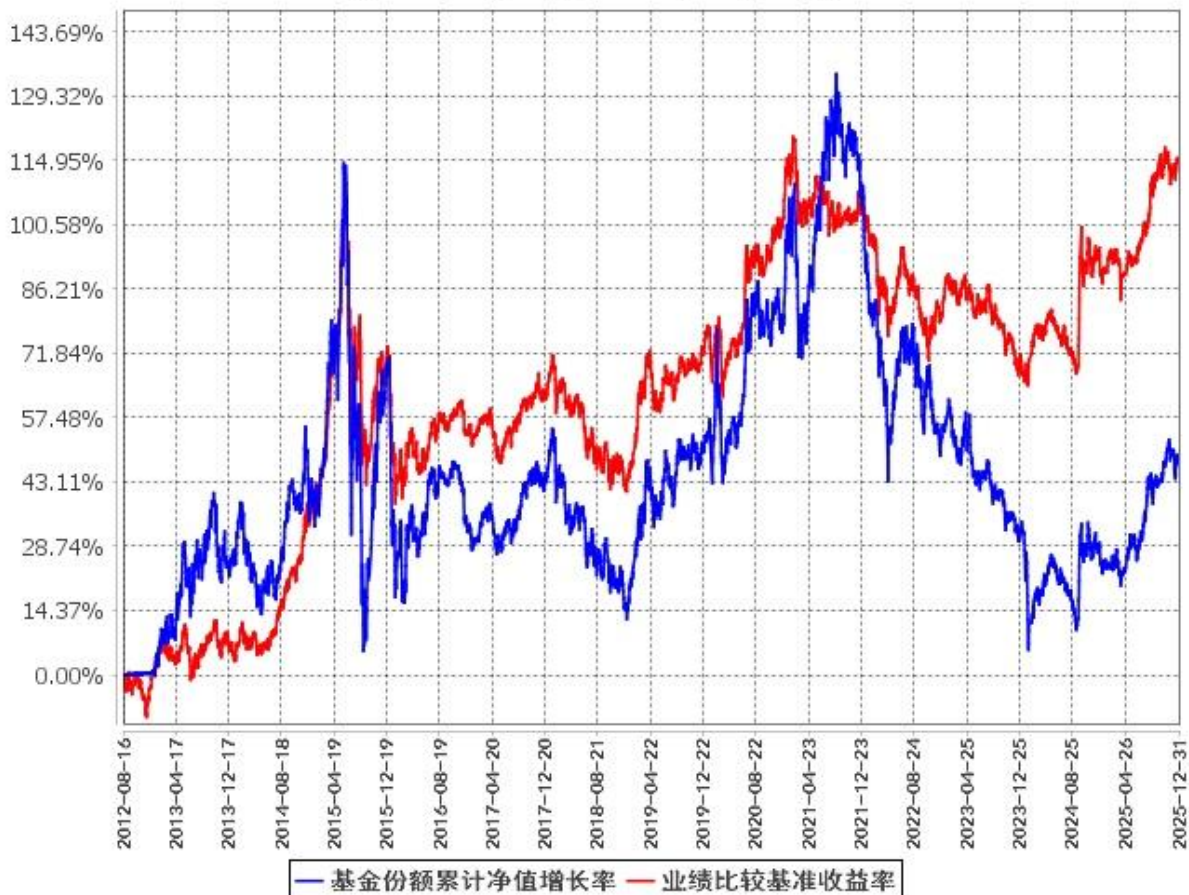
基金份额累计净值增长率与同期业绩比较基准收益率的历史走势对比图 (2012年8月16日至2025年12月31日)