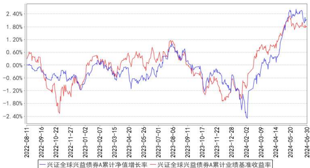
兴证全球兴益债券A累计净值增长率与同期业绩比较基准收益率的历史走势对比图