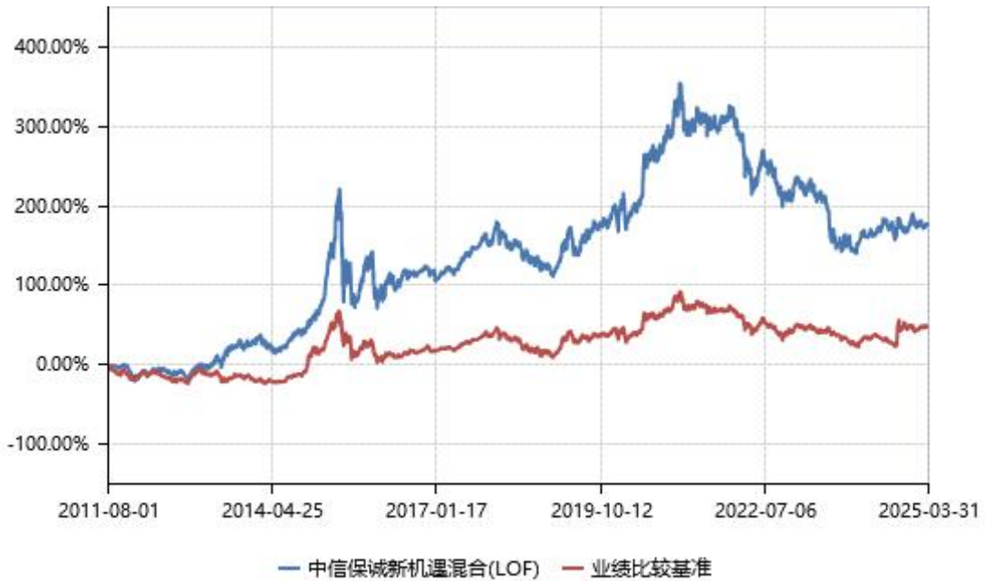
(二) 基金累计净值增长率与业绩比较基准收益率的历史走势对比图