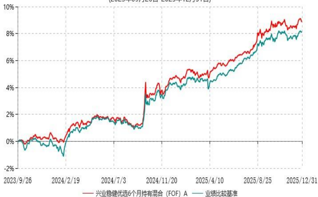
兴业稳健优选6个月持有混合（FOF）A累计净值增长率与业绩比较基准收益率历史走势对比图 (2023年09月26日-2025年12月31日)