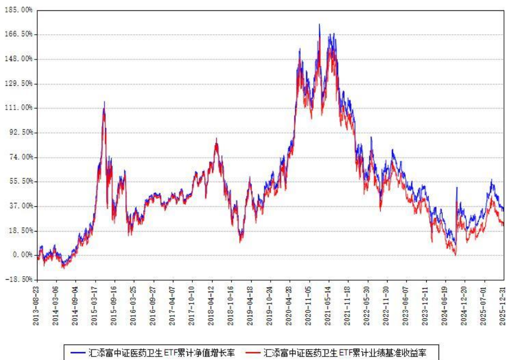
汇添富中证医药卫生ETF累计净值增长率与同期业绩基准收益率对比图

注：本基金建仓期为本《基金合同》生效之日（2013年08月23日）起3个月，建仓期结束时各项资产配置比例符合合同约定。