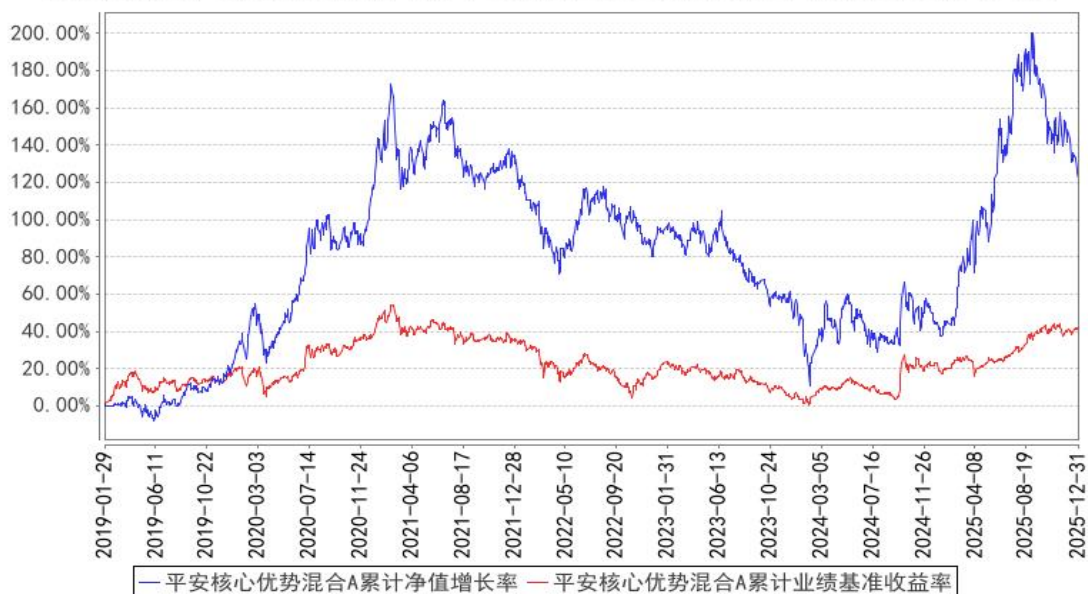
平安核心优势混合A累计净值增长率与同期业绩比较基准收益率的历史走势对比图