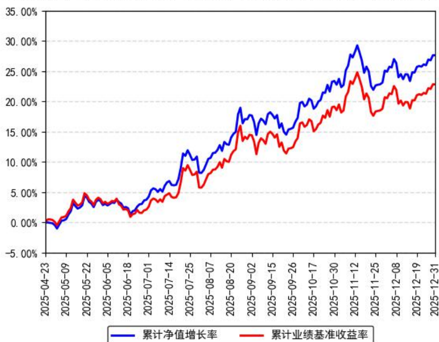
南方中证全指自由现金流ETF累计净值增长率与同期业绩比较基准收益率的历史走势对比图

注：本基金合同于 2025 年 4 月 23 日生效，截至本报告期末基金成立未满一年；自基金成立日起 6 个月内为建仓期，建仓期结束时各项资产配置比例符合合同约定。