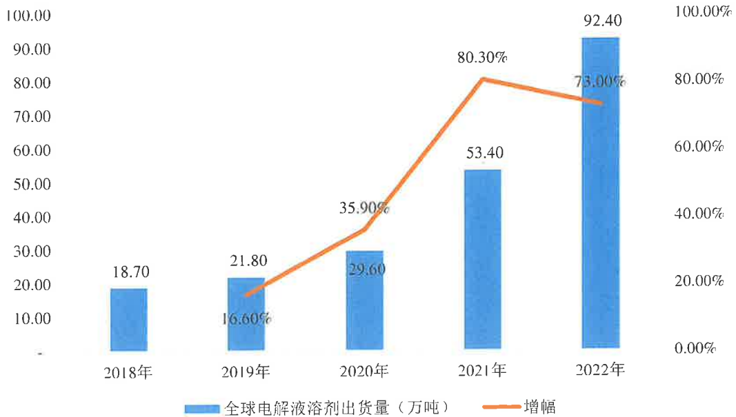
近年全球电解液溶剂出货量情况