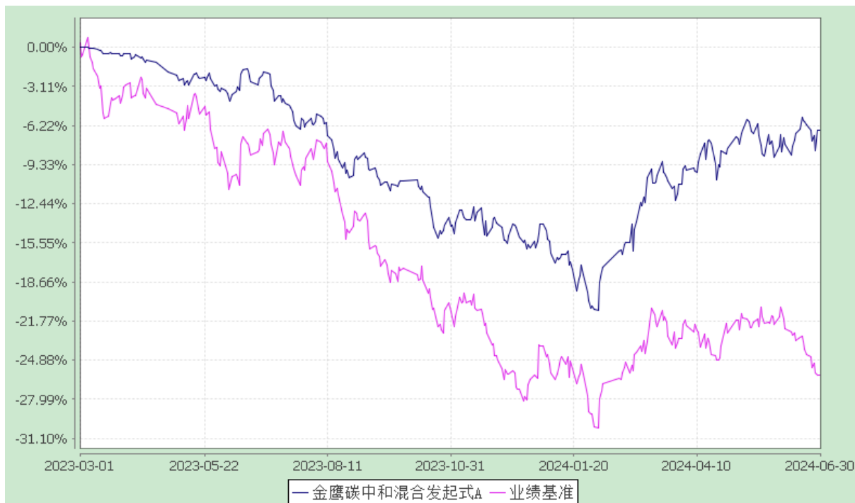
金鹰碳中和混合发起式 C