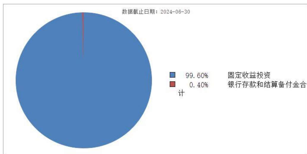
投资组合资产配置图表