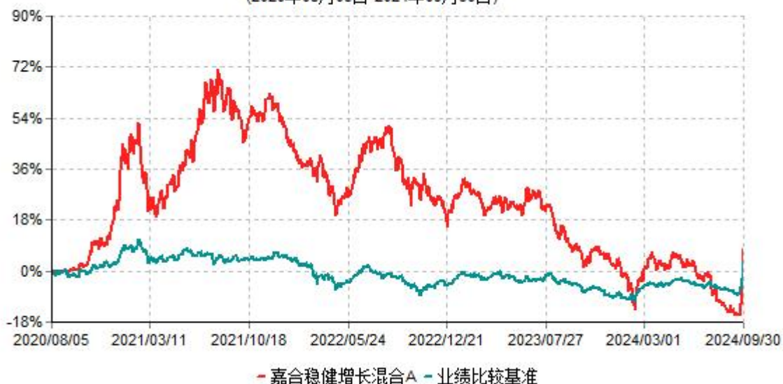
嘉合稳健增长混合A累计净值增长率与业绩比较基准收益率历史走势对比图 (2020年08月05日-2024年09月30日)