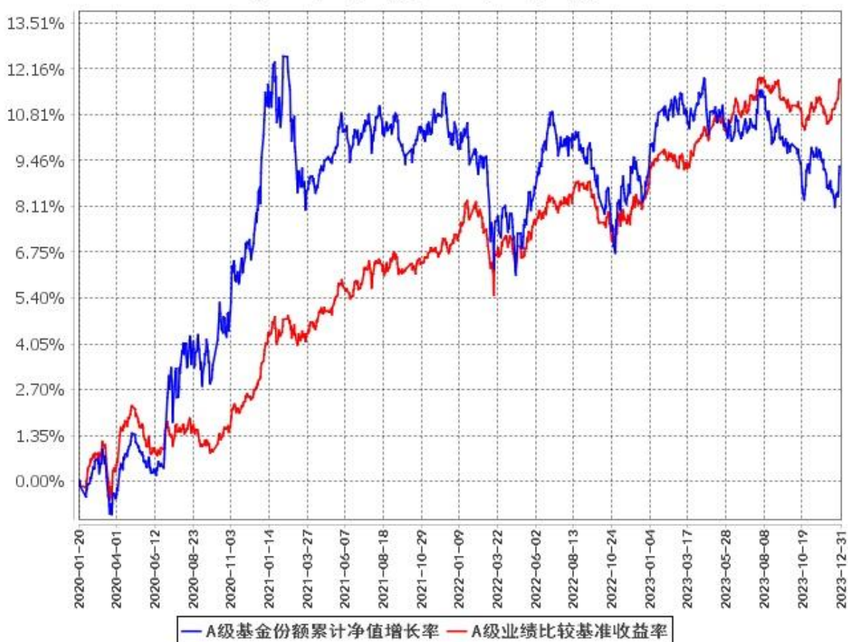
A级基金份额累计净值增长率与同期业绩比较基准收益率的历史走势对比图 (2020年1月20日至2023年12月31日)