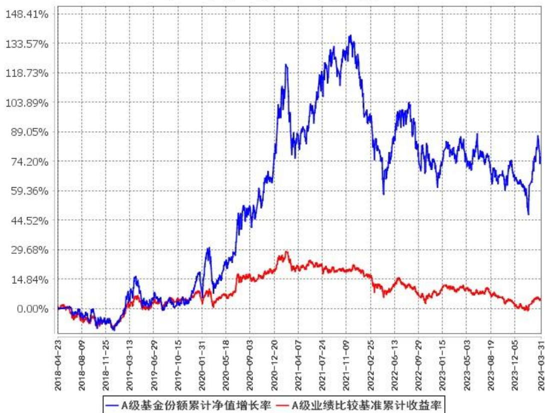
A级基金份额累计净值增长率与同期业绩比较基准收益率的历史走势对比图 (2018年4月23日至2024年3月31日)