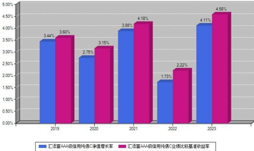
汇添富AAA级信用纯债C每年净值增长率与同期业绩基准收益率对比图

注：数据截止日期为2023年12月31日，基金的过往业绩不代表未来表现。本《基金合同》生效之日为2019年02月22日，合同生效当年按实际存续期计算，不按整个自然年度进行折算。