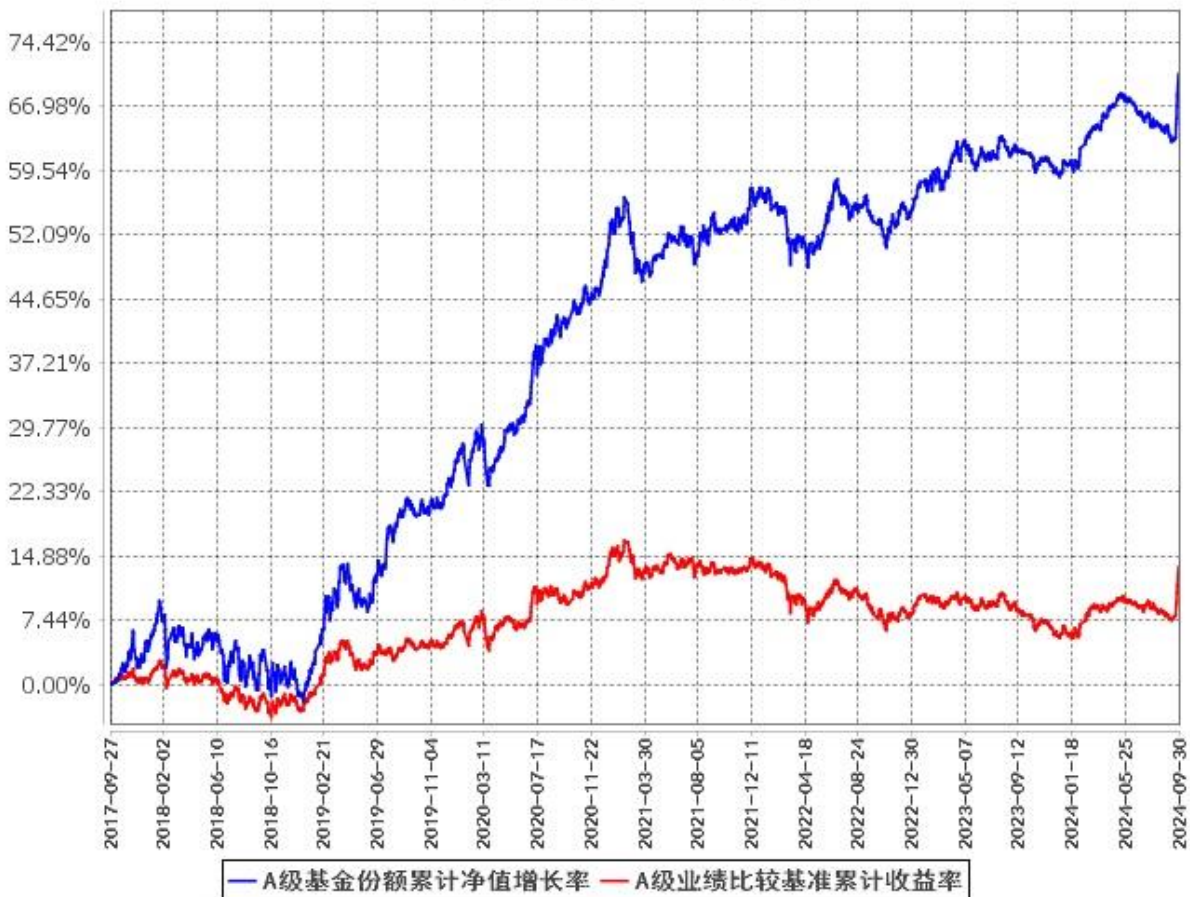
A级基金份额累计净值增长率与同期业绩比较基准收益率的历史走势对比图 (2017年9月27日至2024年9月30日)