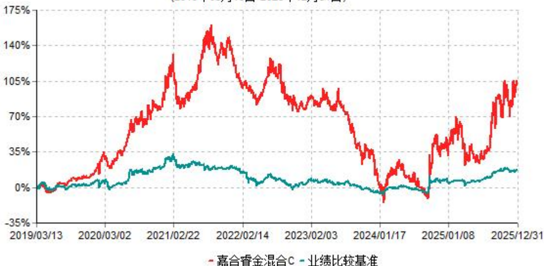
嘉合睿金混合C累计净值增长率与业绩比较基准收益率历史走势对比图 (2019年03月13日-2025年12月31日)

注：1、本基金于2019年3月13日由"嘉合睿金定期开放灵活配置混合型发起式证券投资基金"转型而来。