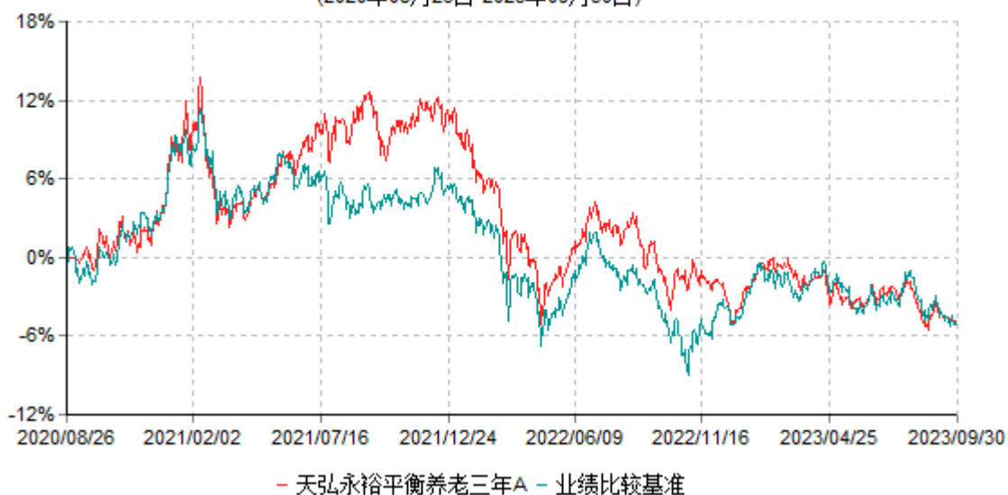
天弘永裕平衡养老三年A累计净值增长率与业绩比较基准收益率历史走势对比图 (2020年08月26日-2023年09月30日)