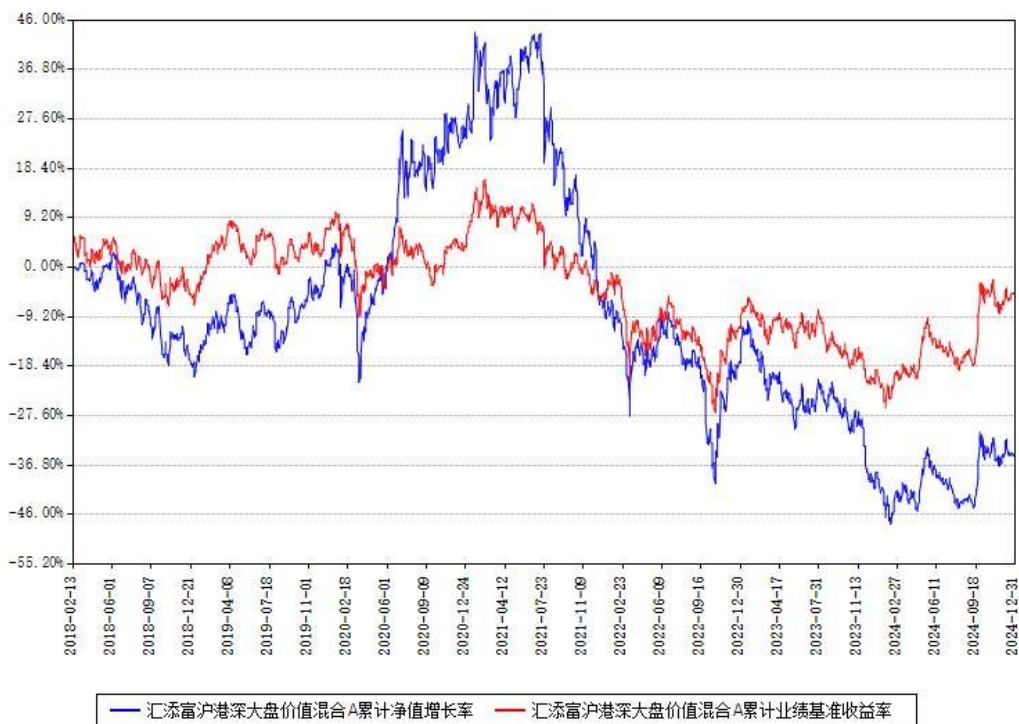
汇添富沪港深大盘价值混合A累计净值增长率与同期业绩基准收益率对比图

(二) 自基金合同生效以来基金累计净值增长率变动及其与同期业绩比较基准收益率变动的比较图