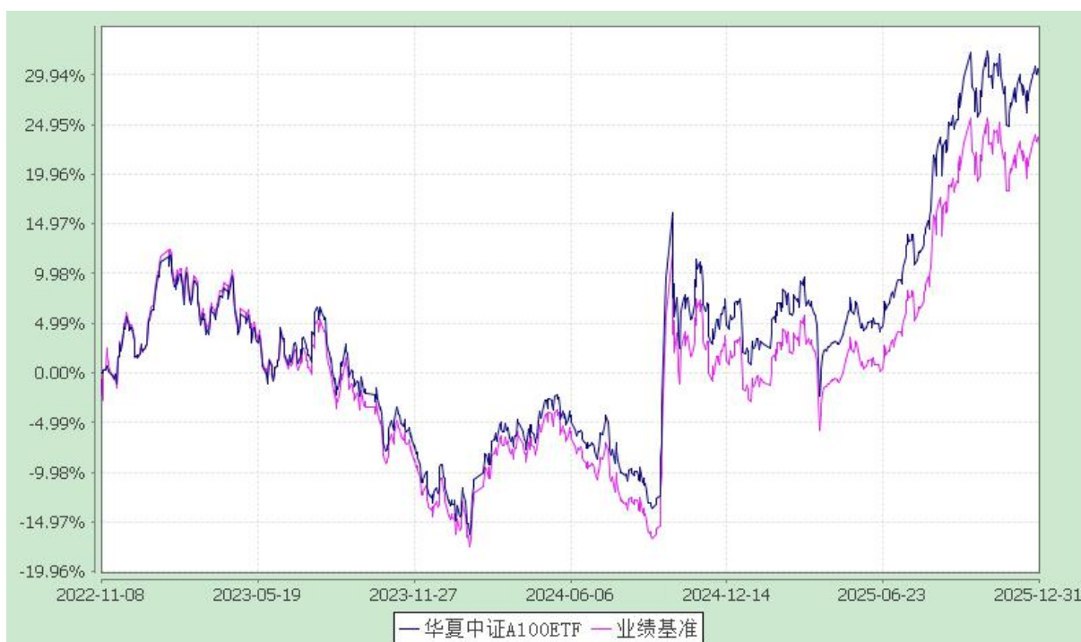
华夏中证 A100 交易型开放式指数证券投资基金 份额累计净值增长率与业绩比较基准收益率历史走势对比图 (2022 年 11 月 8 日至 2025 年 12 月 31 日)