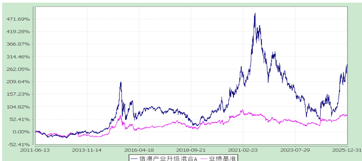
信澳产业升级混合 C 累计净值增长率与业绩比较基准收益率的历史走势对比图