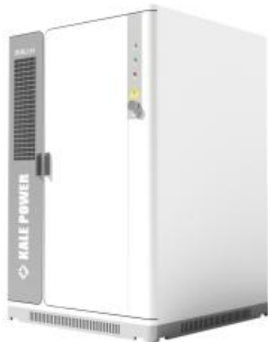
骐骥 233kWh 储能柜一体机

体，自主研发了全液冷储能新品“骐骥 233kWh 储能柜一体机”，具备了更大容量、更长寿命、更高效率、更安全、更灵活、更智慧这六项关键特性，为客户提供一站式高安全性、高可靠性、高效率、长循环寿命的工商业分布式储能电池系统解决方案。