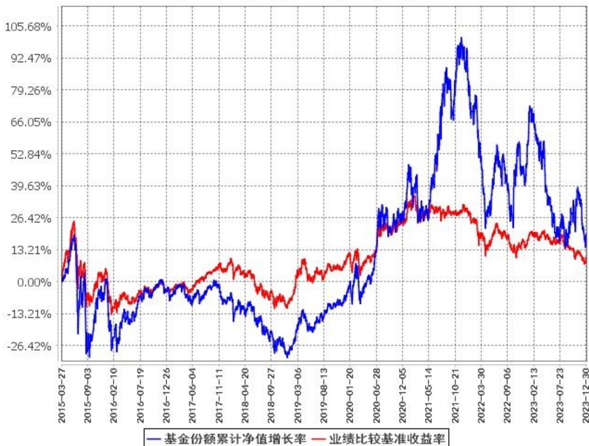
基金份额累计净值增长率与同期业绩比较基准收益率的历史走势对比图 (2015年3月27日至2023年12月31日)