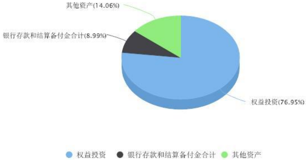
投资组合资产配置图表 数据截止日期:2024年09月30日