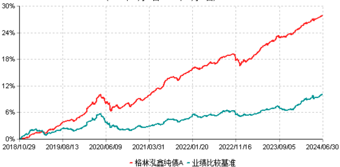
格林泓鑫纯债A累计净值增长率与业绩比较基准收益率历史走势对比图 (2018年10月29日-2024年06月30日)