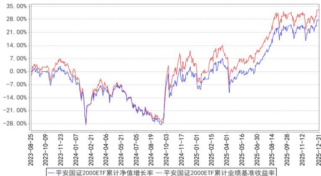
平安国证2000ETF累计净值增长率与同期业绩比较基准收益率的历史走势对比图

注：1、本基金基金合同于 2023 年 08 月 25 日正式生效； 2、按照本基金的基金合同规定，基金管理人应当自基金合同生效之日起六个月内使基金的投资组合比例符合基金合同的约定，截至报告期末本基金已完成建仓，建仓期结束时各项资产配置比例符合基金合同约定。