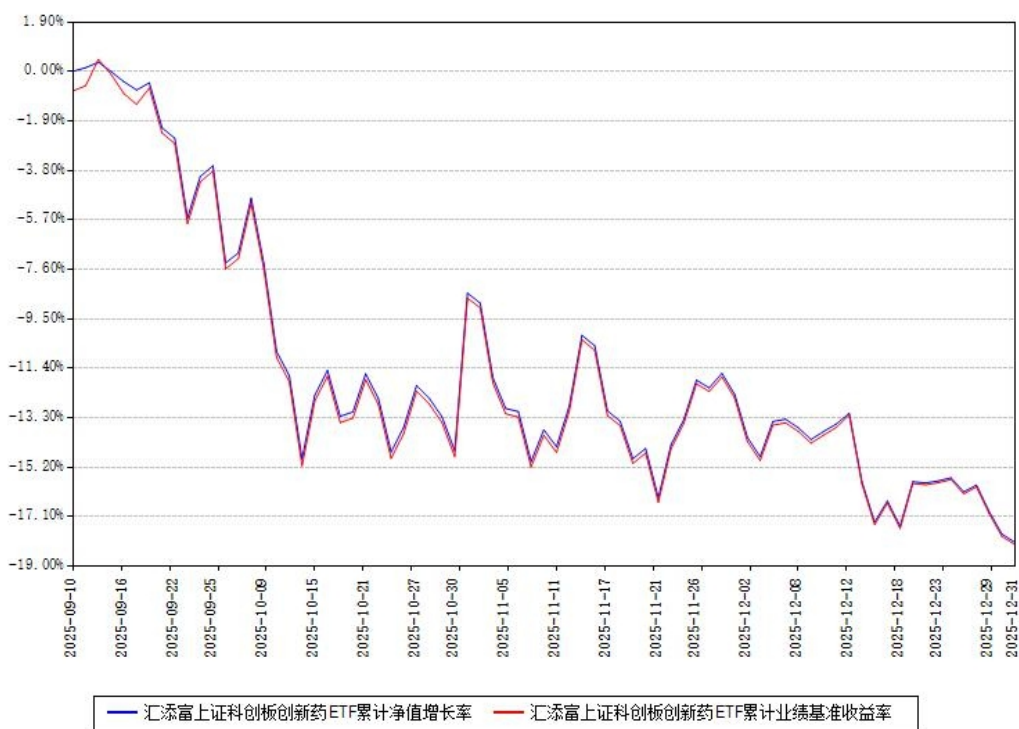
汇添富上证科创板创新药ETF累计净值增长率与同期业绩基准收益率对比图

注：本《基金合同》生效之日为2025年09月10日，截至本报告期末，基金成立未满一年。本基金建仓期为本《基金合同》生效之日起6个月，截至本报告期末，本基金尚处于建仓期中。