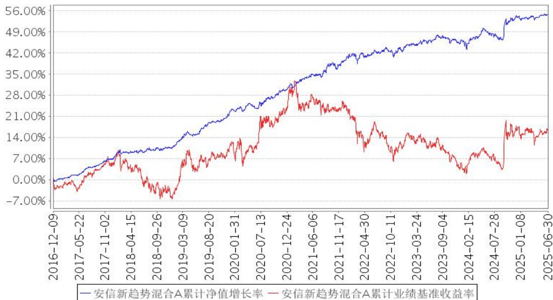
安信新趋势混合A累计净值增长率与同期业绩比较基准收益率的历史走势对比图