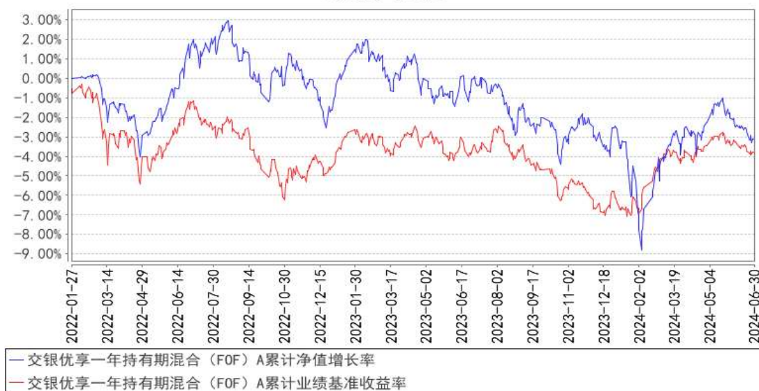
交银优享一年持有期混合（FOF）A 累计净值增长率与同期业绩比较基准收益率的历史走势对比图