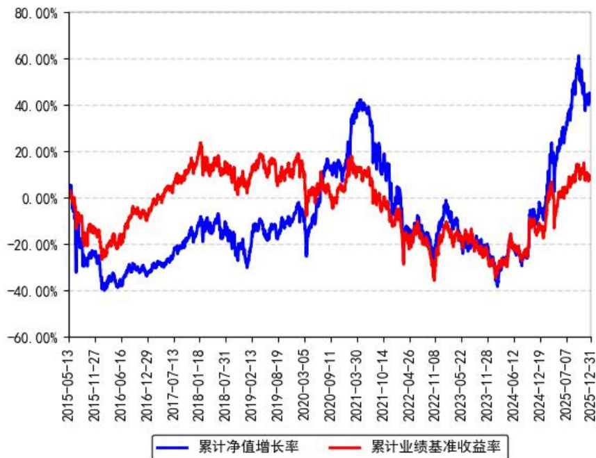
南方香港优选股票（QDII-LOF）累计净值增长率与同期业绩比较基准收益率的历史走势对比图